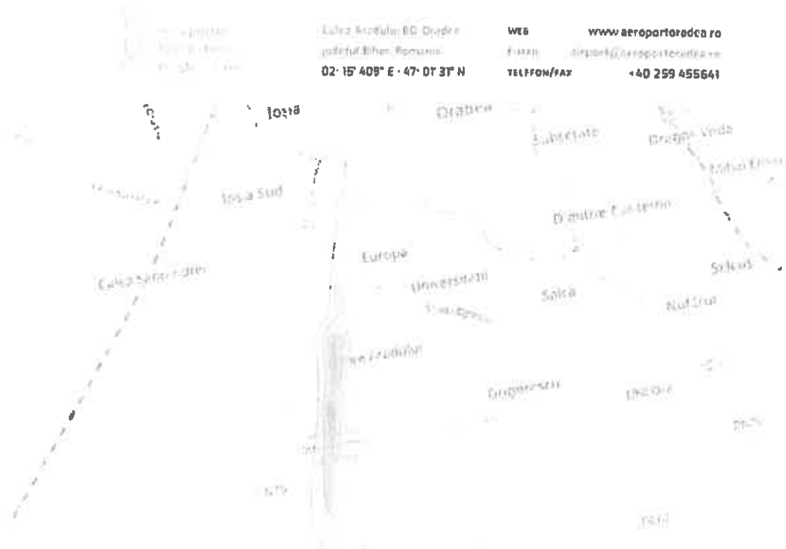
Figura 1. Mapa de zgomot