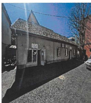
Centrul De Zi