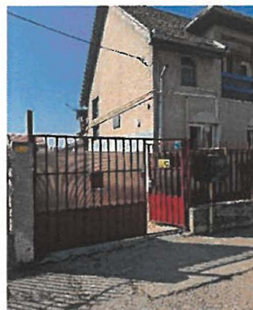
CABRPAD „Franz Max”